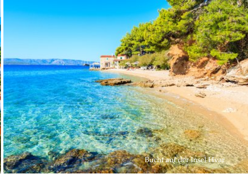
Bucht auf der Insel Hvar