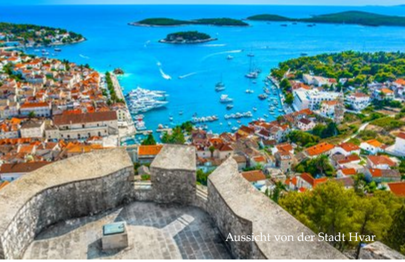
Aussicht von der Stadt Hvar