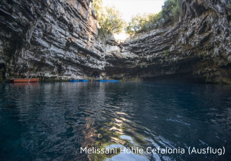
Melissani Höhle Cefalonia (Ausflug)